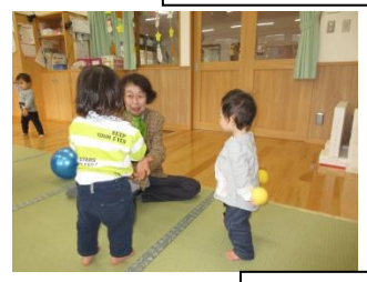
長寿会さんとの交流会