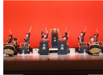
ふれあい余芸大会