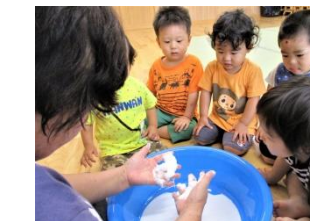
小麦粉粘土で遊びまし